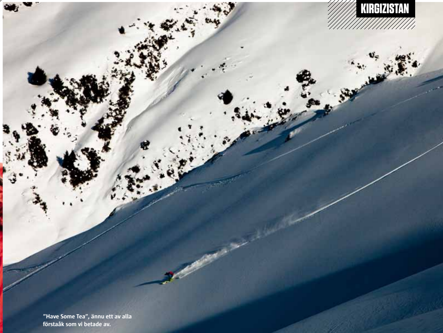
"Have Some Tea", ännu ett av alla förstaåk som vi betade av.

från skogen. Vägen snirklar sig genom flacka åkrar innan den förgrenar sig och klättrar ytterligare 500 meter in mot en vidsträckt dalgång med tall- och granskog. Jurtan röjer sitt läge genom en svag rökpelare från skorstenen, annars ligger den dold bakom en trädunge på en liten ås strax ovan 2 700 meters höjd.