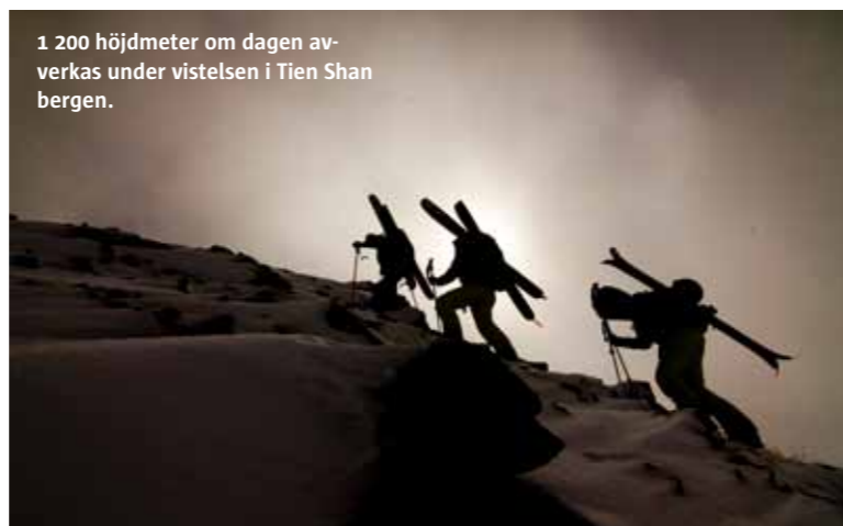
1 200 höjdmeter om dagen avverkas under vistelsen i Tien Shan bergen.