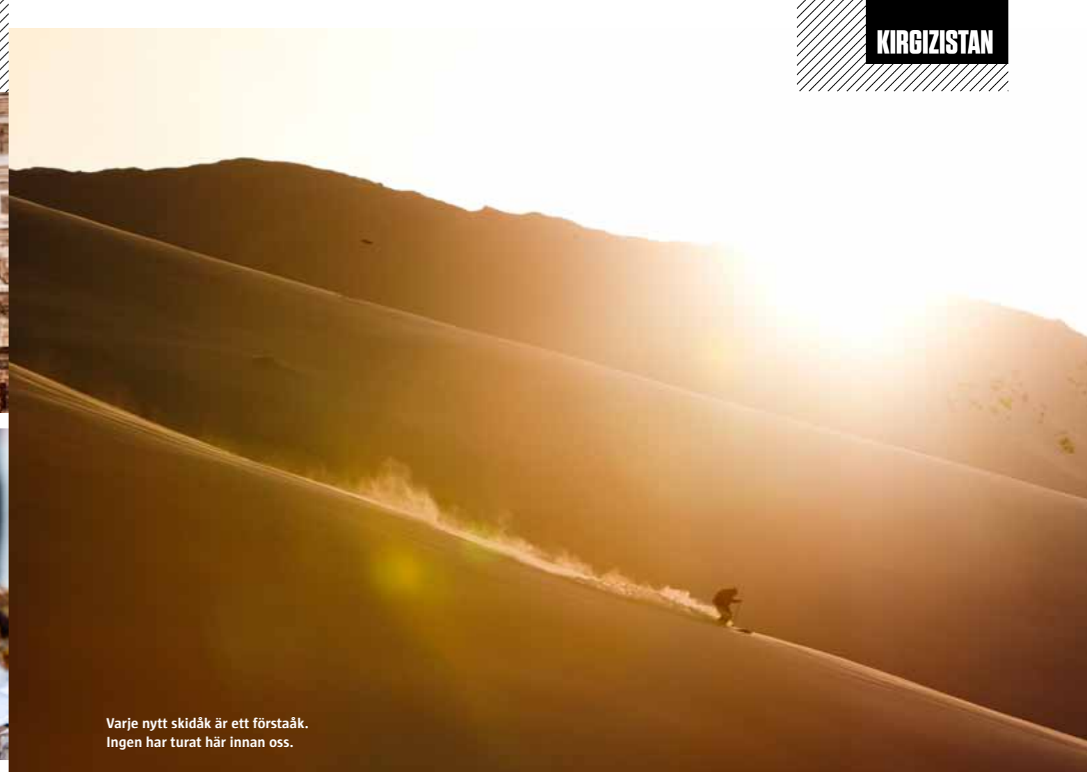
Varje nytt skidåk är ett förstaåk. Ingen har turat här innan oss.