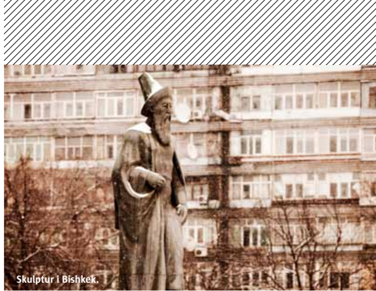
Skulptur i Bishkek.

Då och då passerar vi genom vindpinade byar, avgränsade av fallfärdiga och övergivna Sovjetfabriker och förstörda av väder och vind – en kvarleva från Sovjetunionens kollaps i slutet av 80-talet som bröt ner den kirgiziska ekonomin fullständigt. En gång i tiden var Issyk-Kulområdet en populär semesterdestina-