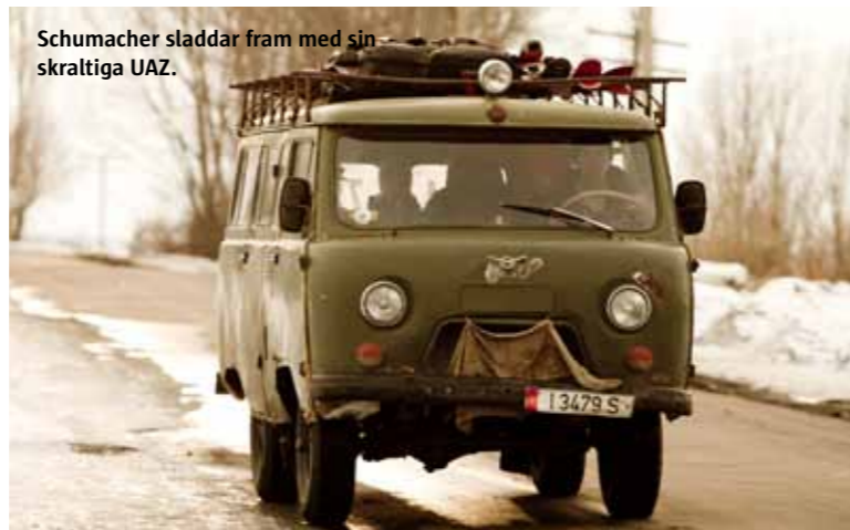
Schumacher sladdar fram med sin skraltiga UAZ.